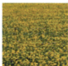
CO 2 -neutrale Verbrennung

Der Typ Ultra Clean eignet sich hervorragend für Bio-Heizöle. (Pflanzliche Öle, tierische Fette und Altspeiseöle).